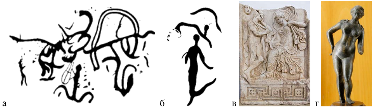
Рис. 4. (а) Богоматерь, наскальный рисунок, Армения, 7-5 тыс. до н.э. (б) Богиня плодородия Астхик - прототип Афродиты (Ванессы), Венеры, наскальный рисунок, Армения, 7-5 тыс. до

Имя Ванасса ассоциируется с принятым в латинской традиции именем богини " Venus ", которое намного более древнее, чем греческий аналог 37 . Самый ранний из известных поэтов, упоминающих Афродиту, Гомер жил на несколько столетий позже периода фактического зарождения культа (источник википедия). По мнению автора, названия материков Азия , Европа и Африка даны в честь женских богинь ( Асия , Ванесса (Европа) и Афрос ), которые связаны с более древней армянской богиней - Астхик . Наименования же стран, как правило, соответствовали мужским именам (первым правителям), например, Айастан происходит от Айка , Финикия - от Фойника , Киликия - от Килика , Армения - от Арама .