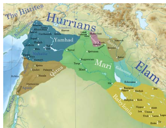
Рис. 4. Накануне завоеваний Шамши-Адада I. Сирийские и месопотамские царства, включая территорию независимого Ашшура при Эришуме II. Около 1810 до н. э. https://ru.wikipedia.org/wiki/Ассирия#/media/Файл:Third_Mari.png