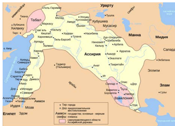
Рис. 3. Ассирийская держава, около 654 г. до н. э. https://ru.wikipedia.org/wiki/Ассирия#/media/Файл:Assyria_map_ru.svg

Здесь следует вновь упомянуть данные М. Хоренаци. Ассирийские страны, захваченные потомками Айка , включали территории Финикии, Киликии, Сирии и др. (рис. 3 - 5). Его сын Араманьяк (отец Кадма ) и, очевидно, Арам не предки Авраама (см. М. Хоренаци), однако библейские авторы Аврааму приписывали некоторые подвиги Арама (также, как и древние греки приписывали Гераклу подвиги Ваагна ).