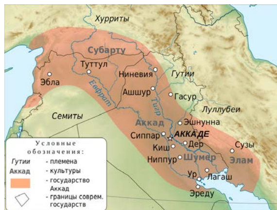
Рис. 4. Аккадское царство при Нарам-Суэне. Конец XXIII в. до н. э. https://ru.wikipedia.org/wiki/Ассирия#/media/Файл:Map_of_Akkad.svg