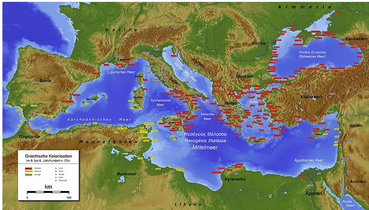
Рис. 2. Финикийские (жёлт.) и греческие (красн.) колонии http://cyclowiki.org/wiki/Финикийские_колонии

поскольку были достойными мужами из родов Кадма , Фойника и Килика . Среди них Багратуни и Амагуни (М. Хоренаци). Из вавилонского плена был освобожден иудейский вождь Шамба Багават или Смбат Багратуни, поселенный с почестями и одаренный лучшими землями и поместьями, наконец. Более того, он получил титул венценолагателя (М. Хоренаци). Эти и другие известные финикийцы, на самом деле, не евреи, они иудействующие потомки Кадма , Фойника и Килика . Среди потомков древних армянских колен из финикийских колонистов относится и карфагенский полководец Ганнибал , скрывавшийся от римлян в Армении. По его плану был построен город Арташат (М. Хоренаци).