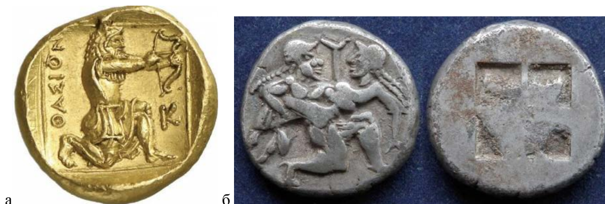
Рис. 1. а) Фасос – лучник с головным убором типа фригийского колпака, б) Фракия, Фасос, 500-463 годы до Р.Х.

кийцами основал Фасос (Павсаний), отправился на поиски Европы вместе с Кадмом и, не найдя её, поселился во Фракии , основав там город Фасос на одноименном острове. Кадм основал город Фивы и стал первым его царём, его жена Гармония , по одной из греческих версий, дочь Арея и Афродиты. Следы мифа о Кадме встречаются на Евбее, Цикладах, Родосе, в Спарте, Милете, Сидоне и др. местах.