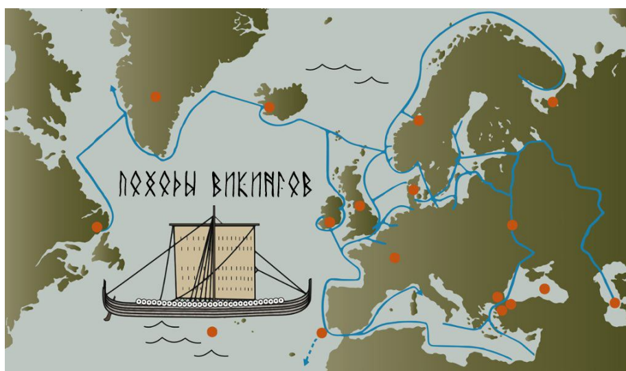
Маршруты походов викингов 11

На карте представлены маршруты походов викингов. По мнению авторов, походы достигали моря Ван (Ваналанд). Уровень озера Ван был когда-то намного выше нынешнего и судоходные реки соединяли Ван с Черным и Средиземным морями. Исследователи озера обратили внимание на террасы по берегам, которые свидетельствовали о том, что ранее уровень воды в озере был на 55 метров выше, чем в настоящее время 12 . Последующие исследования подтвердили, что в середине последнего оледенения, около 18 тысяч лет назад, уровень озера Ван был на 72 метра выше, чем в настоящее время. 13 Таким образом, первые маршруты походов асов и ванов в Скандинавию имели место, когда уровень озера Ван был выше. Местные жители и некоторые историки упоминают не озеро, а море Ван.