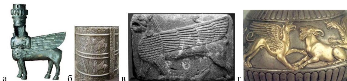
(а, б) Урартские (Ванские) грифоны, (б) Фригийский грифон (Фригия - историческая область на западе Малой Азии). VII век до н.э. Музей Анатолийских Цивилизаций (Анкара), (г) Артефакт из Евпатории (скифский курган)