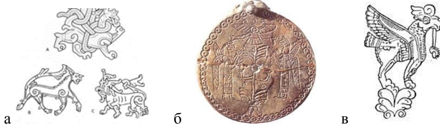
(а) Мотив великого зверя (по стилю и композиции напоминает мотив урартских (Ванских) грифонов (б, в), а также грифонов из средневековых армянских манускриптов 9