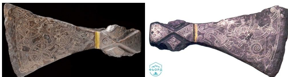
Топор викингов из захоронения Маммен 8

друг на друге косо́й (символ Астхик) и прямо́й (символ Ваагна) кресты. Сила удара топора, таким образом, определяется рукояткой с восьмиконечной звездой.