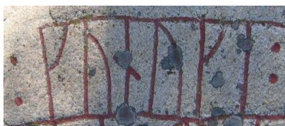
Надпись конунг (kunungi) на руническом камне U 11 5

Положение конунгов являлось наследственным, но для того, чтобы вступить на престол, ему требовалось одобрение народа. Это обстоятельство нередко приводило к -двоевластию, когда два брата одновременно становились конунгами. В ранний период конунгу принадлежал один или несколько кораблей, дружина (др.-сканд. drótt) и обширный земельный надел - вотчина. Последнее нередко становилось причиной феодальных междоусобиц. В некоторых случаях конунг не имел земельных владений и вел странствующий образ жизни на корабле - таких конунгов называли сэконунгами (морскими конунгами). В качестве жреца, конунг просил одобрения своих действий богами. Например, Эйрик Победоносный обращался к Одину на третий день Битвы на Фирисвеллире. Также конунг руководил блотом в важных общественных местах, таких как Храме Уппсалы. Отказ от этой обязанности мог стоить конунгу власти (источник википедия).