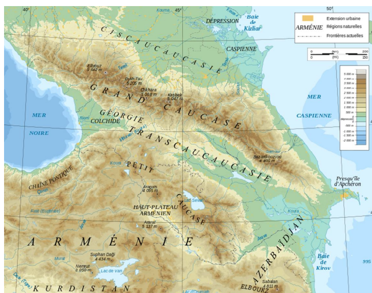
Рис. 1. Кавказ, кавказские горы и Армения. Caucasus mountain range

Имя титана “Прометей” означает “мыслящий прежде”, “предвидящий” (в противоположность имени его брата Эпиметеева, “думающего после”) и считается производным от индоевропейского корня me-dh-, men-dh-, “размышлять”, “познавать”. In Greek mythology, Prometheus (Greek: Προμηθεύς, meaning "forethought") is a Titan, culture hero, and trickster figure who is credited with the creation of man from clay, and who defies the gods and gives fire to humanity, an act that enabled progress and civilization. Prometheus is known for his intelligence and as a champion of mankind.