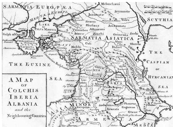
Рис. 2. Вторая карта Азии включает Сарматии, находящуюся в Азии. Лондон, 1770 г.

Асия (Азия, микен. a-si-wi-ja) - персонаж древнегреческой мифологии. По гипотезам современных ученых, эпитет - по городу Асиос на Крите либо от области Асия в Малой Азии. В древнегреческой мифологии это океанида, дочь Океана и Тефии. Согласно Геродоту, Асия - жена Прометея , от которой названа часть света Азия (Геродот. История IV 45). По другой родословной, Асия - жена Иапета, мать Прометея . Таким образом, имена Кавказ, Азия и Европа, а также Евразия имеют протогреческое, протоармянское (армяно-греческое происхождение).