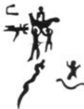
Рис. 4. Наскальное изображение судна, возможно кожаное, которое несут на руках (гора Арагац, Армения)

Современные писатели предполагают возможную связь между Белом и Баалом. Семитское “баал, ваал” означает “владыка, хозяин, бог”; божество или обожествление царя у северо-западных семитов (источник википедия).