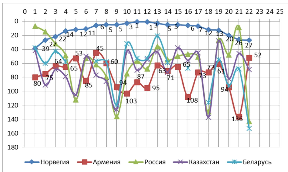
Рисунок 2. Показатели НИК России, Казахстана, Беларуси, Армении и Норвегии (лидера по НИК среди стран Европейского союза)